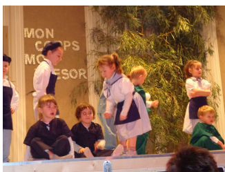
Spectacle de Noël