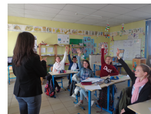
Une heure d'anglais par semaine par un professeur