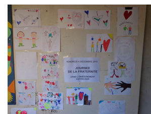
La journée de la fraternité