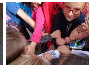
Se soutenir, s'entraider, ...