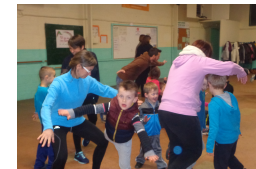
Atelier danse avec les parents