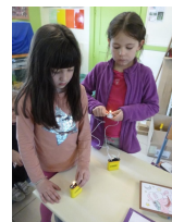
Initiation à l'électricité