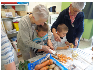
Partenariat avec des personnes à la retraite