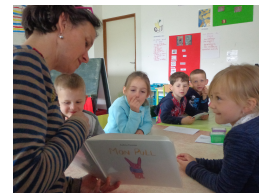
Enseignante spécialisée (1 journée par semaine)