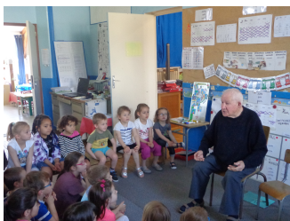
Rencontre avec des artistes locaux