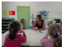
Aide personnalisée en petits groupes (1 heure par semaine)