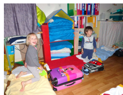
En maternelle, une nuit à l'école comme mon papy et ma mamie, sans électricité...