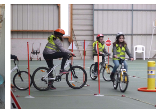
Initiation à la sécurité routière