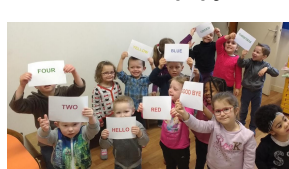
Anglais dès la maternelle